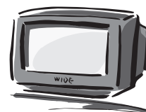
テレビ(ブラウン管式)