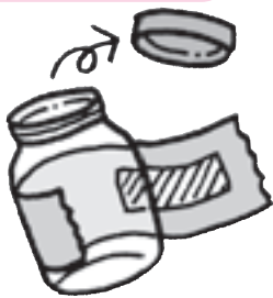
キャップ(ふた)とラベルをはずす