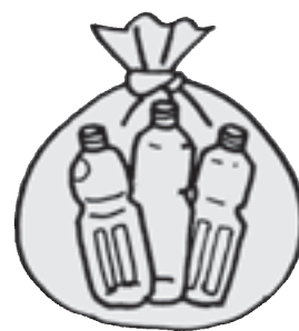
中身の見える袋に入れる