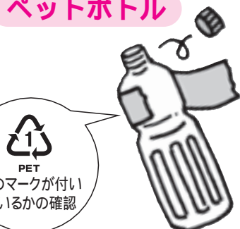
キャップ(ふた)とラベルをはずす