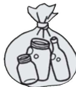
中身の見える袋に入れる