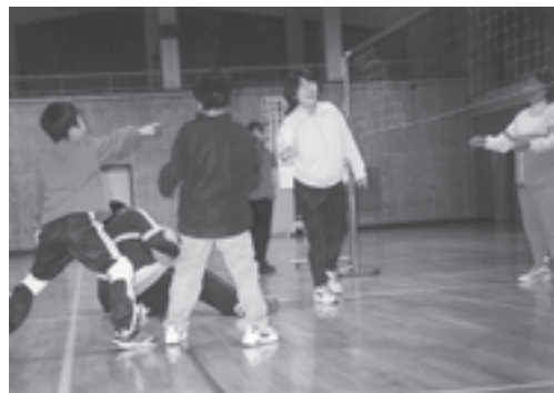
和気あいあいのソフトバレー