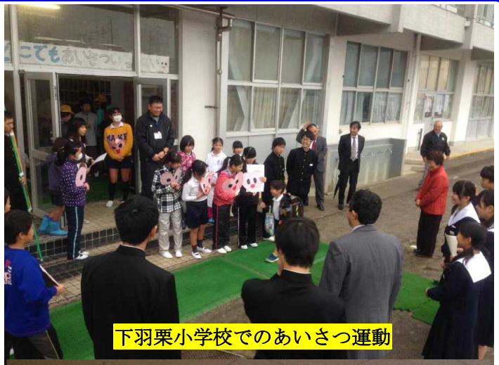
下羽栗小学校でのあいさつ運動