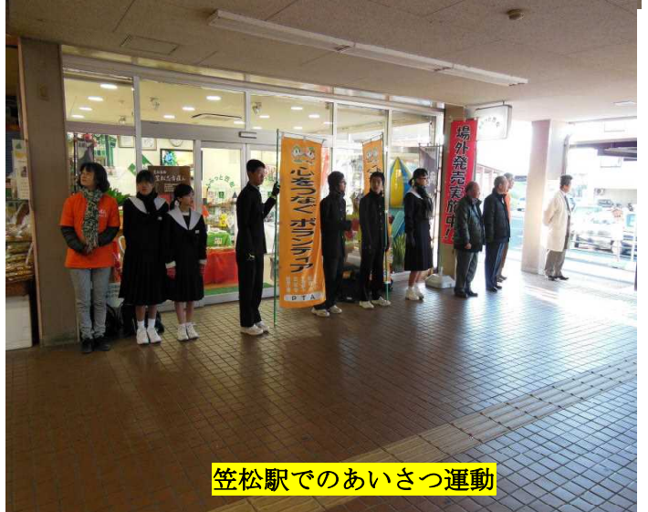
笠松駅でのあいさつ運動

寒い中、3日間にわたって皆様のご参加をいただき、誠にありがとうございました。心より感謝いたします。