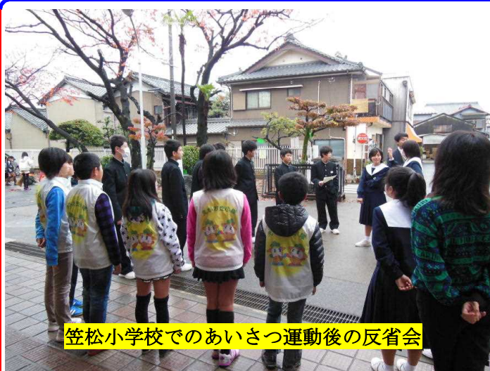
笠松小学校でのあいさつ運動後の反省会