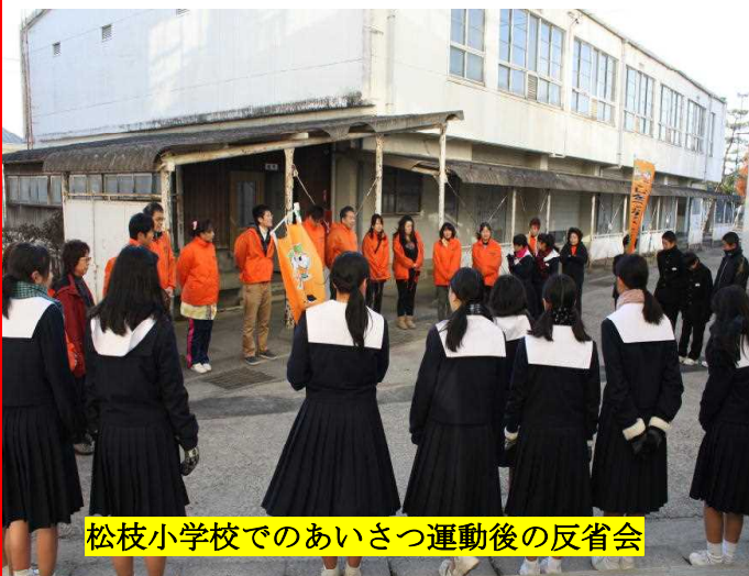
松枝小学校でのあいさつ運動後の反省会