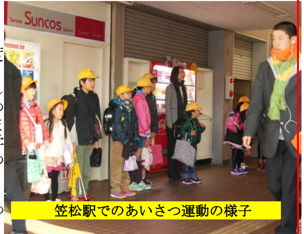
笠松駅でのあいさつ運動の様子

なお、このあいさつ運動は第3回目が、平成27年2月18日から20日に予定されています。3回目のあいさつ運動にも多数の方々のご参加を是非、お願いいたします。