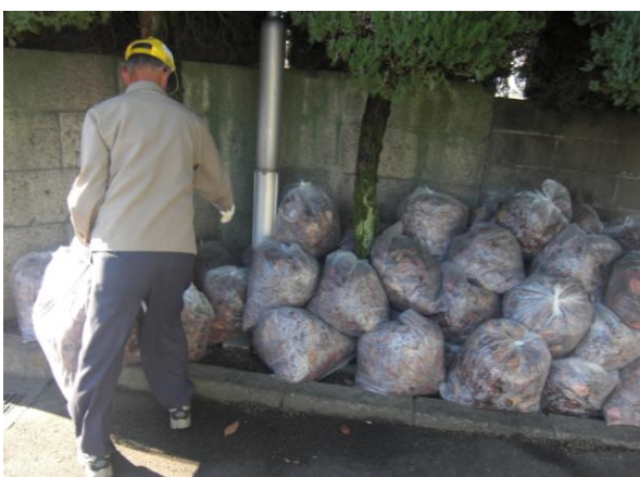
集められた落ち葉 (緑町墓地で)

「つき美・みどり会」で清掃を始めて二年になり、これまでに三十回ほど行われています。毎回二十〜三十名の会員の方が参加されます。清掃日に来ないからと言ってとがめる人はいません。一人ひとりの意思と健康を尊重しながら一人ひとりのペースで作業が進められています。