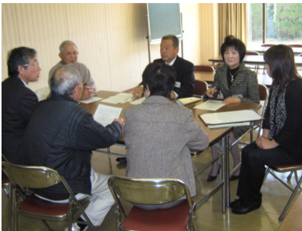
「あいさつのあるまちづくり」についてグループごとに話し合う

わが町笠松も心を大切にす町にしたい。身近なあいさつから笠松の風土をつくる。みんな決意を新たにしました。