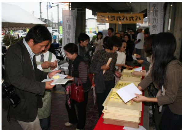
パカパカだんごを試食 (笠松中央公民館前)

この日、午後は雨。しかし、多くの方が試食コーナーに足を運ばれ、だんごはあつという間になりました。だんごを味わった感想もお聞きしました。岐阜女子大学「我輝部」の踊りを見、同大学作詞・元気きそがわ作曲による「パカパカだんごの歌」も聞いていただき、まちづくりに込める熱い思いを感じ取っていただきました。